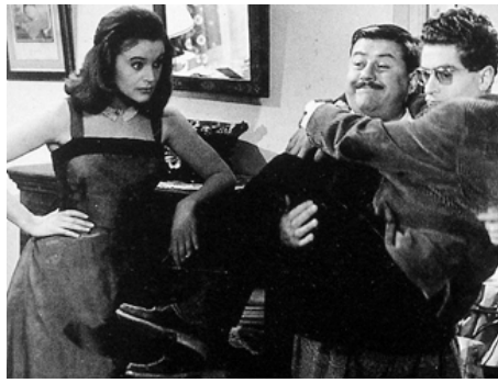
1960 LES PIQUE-ASSIETTE de Jean Girault avec Francis Blanche, Darry Cowl