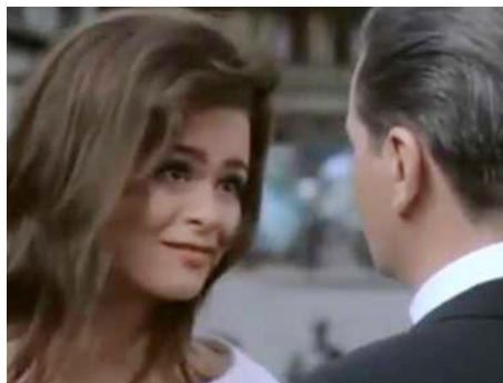
1963 DUEL SUR LE CIRCUIT (The Young Racers) de Roger Corman avec William Campbell