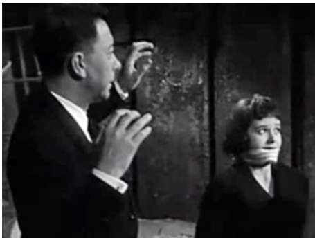
1957 LES VIOLENTS d'Henri Calef avec Paul Meurisse