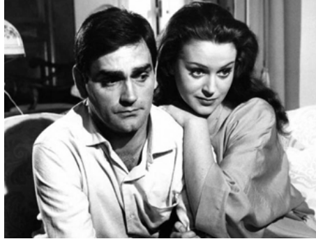
1961 À HUIS CLOS (A Porte chiusa) de Dino Risi avec Vittorio Caprioli