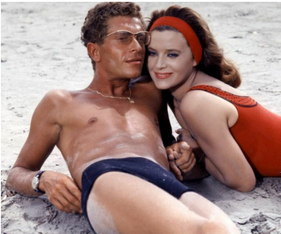
1960 ROBINSON ET LE TRIPORTEUR de Jack Pinoteau avec Darry Cowl