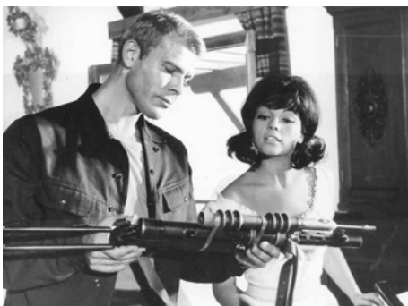
1965 AGENT 3S3, PASSEPORT POUR L'ENFER (Agente 3S3) de Sergio Sollima avec G. Ardisson