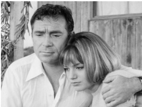
1962 ELLE EST TERRIBLE (La Voglia matta) de Luciano Salce avec Ugo Tognazzi