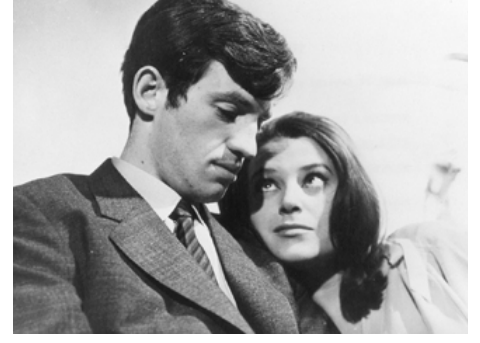
1961 UN NOMMÉ LA ROCCA de Jean Becker avec Jean-Paul Belmondo