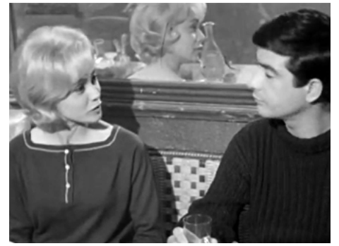
1961 LE PUIT AUX TROIS VÉRITÉS de François Villiers avec Jean-Claude Brialy