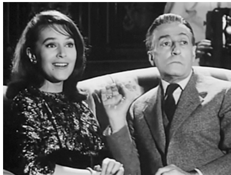
1962 TOTO DIABOLIQUE (Totò diabolicus) de Steno avec Totò