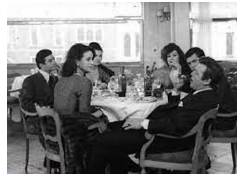
1962 LA BANDE CASAROLI (La Banda Casaroli) de Florestano Vancini avec J-C. Brialy, Tomas Milian