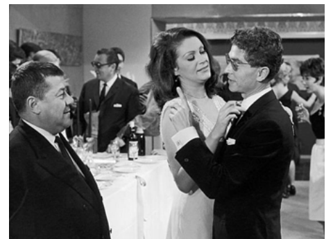
1965 LES GORILLES de Jean Girault avec Francis Blanche, Darry Cowl