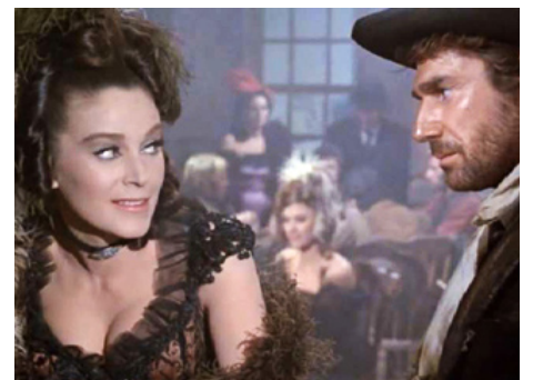
1969 UNE CORDE, UN COLT... de Robert Hossein avec Robert Hossein