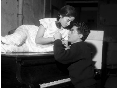
1957 L'AMI DE LA FAMILLE de Jack Pinoteau avec Darry Cowl