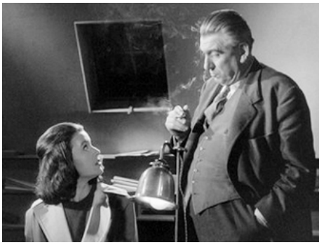
1960 LES YEUX SANS VISAGE de Georges Franju avec Alexandre Rignault