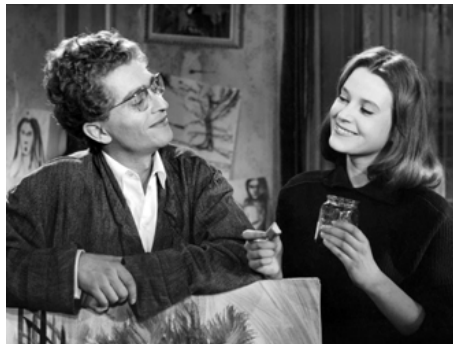
1958 LE TEMPS DES ŒUFS DURS de Norbert Carbonnaux avec Darry Cowl