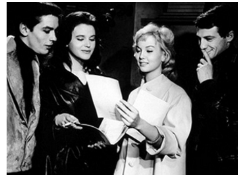
1958 SOIS BELLE ET TAIS-TOI de Marc Allégret avec Alain Delon, Mylène Demongeot, J-P. Belmondo